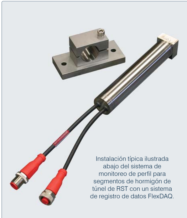
Instalación típica ilustrada abajo del sistema de monitoreo de perfil para segmentos de hormigón de túnel de RST con un sistema de registro de datos FlexDAQ.